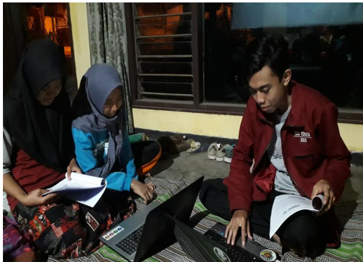
Gambar 4 Peserta didik semangat mengikuti kegiatan

Dari Pembelajaran yang telah dilakukan kepada peserta didik Desa Sumberjati , maka minat belajar peserta didik tentang ilmu komputer, khususnya Pengoprasian Microsoft Word dan Microsoft Excel menjadi lebih besar. Para peserta didik mulai bisa mengoprasikan komputer dengan baik. Dengan menggunakan fasilitas-fasilitas yang telah tersedia peserta didik mampu mengoprasikan komputer dengan baik. Dapat dilihat pada gambar berikut Gambar 4. Peserta didik semangat mengikuti kegiatan sebagai berikut.