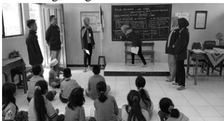
Gambar 3 (a)

Selanjutnya yakni penjelasan tentang Wa’Nakeb penting diberikan kepada adik-adik karena hal tersebut merupakan salah satu metode menabung yang menarik dan membuat laporan keuangan adik-adik lebih jelas dan terperinci. Dengan metode Wa’Nakeb adik-adik dapat lebih rutin untuk menabung, dengan mendaftarkan semua kebutuhan mereka, serta dapat menghindarkan pemborosan.