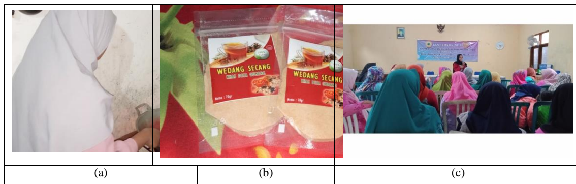
Gambar 2. a) Ikut aktif dalam pelatihan pembuatan wedang secang, b) Menentukan kemasan dan label, c) Sosialisasi pemasaran bersama Ibu PKK

Evaluasi dilakukan melalui kunjungan ke beberapa rumah ibu PKK untuk mengavaluasi penguasaan materi, pelaksanaan kegiatan, dan dampak setelah program. Selain itu, mengevaluasi penerapan skill yang telah diberikan. Secara terperinci rancangan evaluasi program ini terlihat pada table 1.1 sebagai berikut :